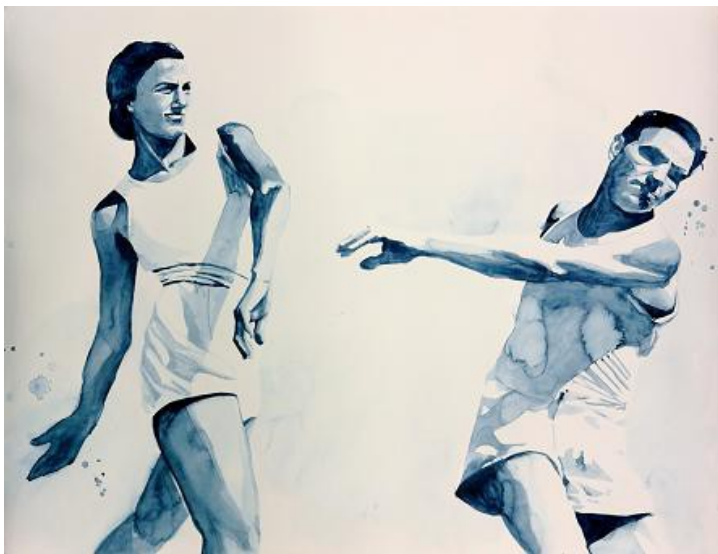
La Gifle, 2015, 125x95cm, aquarelle sur papier

Un travail de mémoire qui procède à partir d'images, le plus souvent photographiques, publiques ou privées, considérées comme autant de témoignages de ce qui a été. Giulia Andreani les réactive sur la toile pour les inscrire dans une durée moins fragile et plus sensible de la peinture. Elle peint aussi bien les puissants que les sans-grades, les obscurs, les effacés, avec une attention particulière pour les femmes. L'image peinte, sans épaisseur, dans un camaïeu à partir du gris de Payne, semble flotter à la surface du tableau qu'elle occupe rarement dans sa totalité comme si elle était l'impression d'un souvenir ou d'un fantôme.