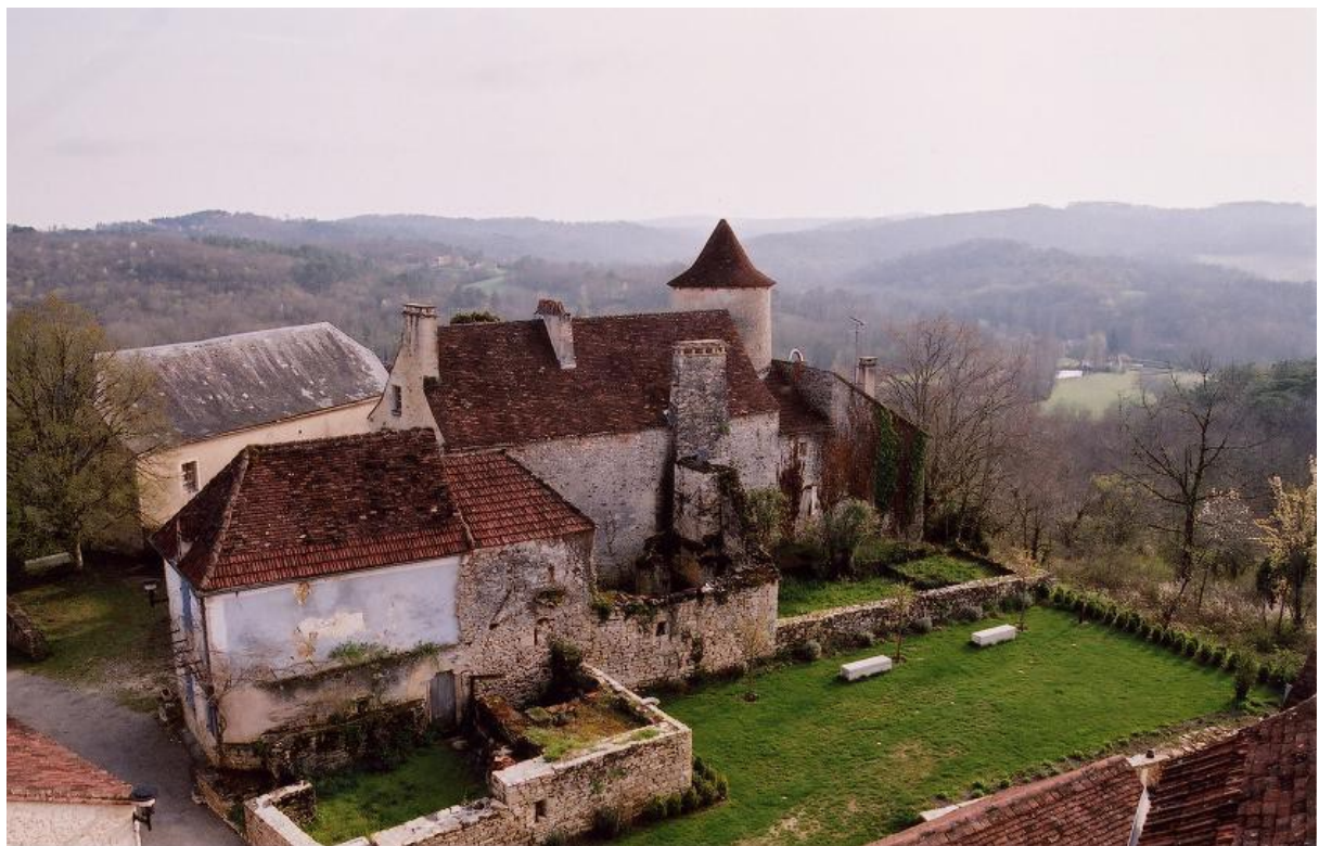
Ancienne maison et atelier d'Ossip Zadkine aux Arques

La 26ème résidence d'artistes D'Avril à Juillet 2016