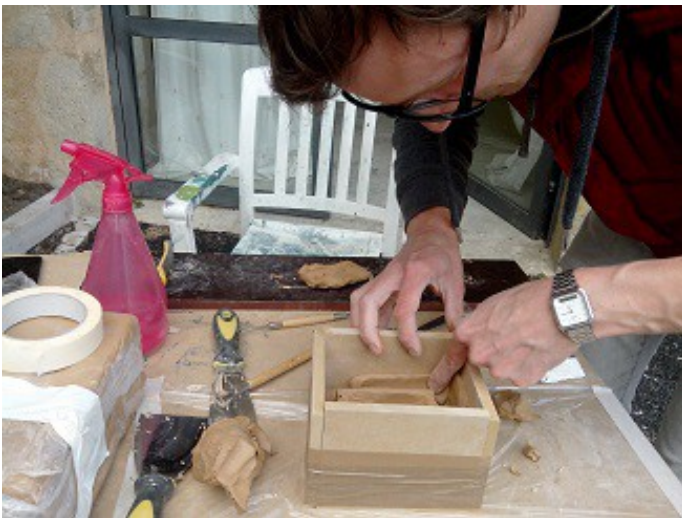
Préparation d'une maquette de la mairie des Arques